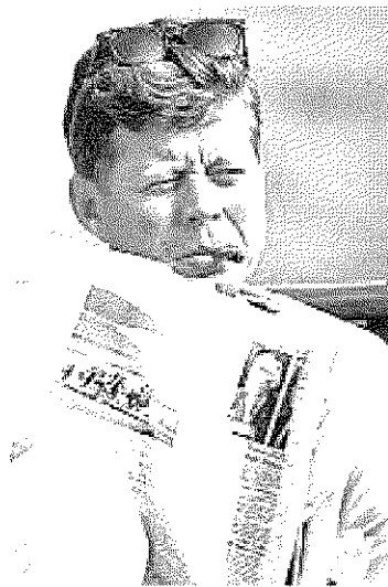
John F. Kennedy

El autor de «Bodies» subraya una y otra vez que «Un adúltero americano» es una novela, no una biografía, y quizá por eso mismo desvela que no siempre quiso abordar la figura de JFK. «Quería escribir sobre un personaje que tuviese una gran contradicción entre su vida pública y su vida privada; alguien que en su vida privada fuese adicto al sexo, y lo primero en lo que que pensé fue en escribir sobre una estrella del deporte», explica. «Si hubiese tenido un poco de visión de futuro podría haber escrito sobre Tiger Woods», añade con sorna.